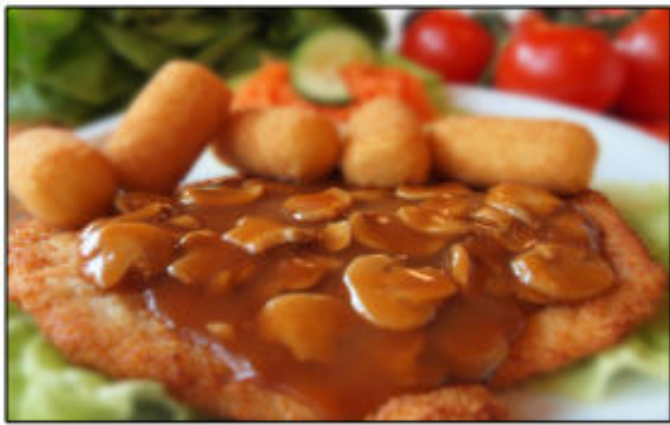
Jägerschnitzel mit Kartoffelkroketten und Beilagensalat